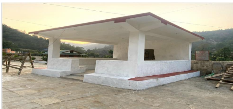
वडा नम्बर ५ मा गाउँपालिका प्रतिक्षालय निर्माण