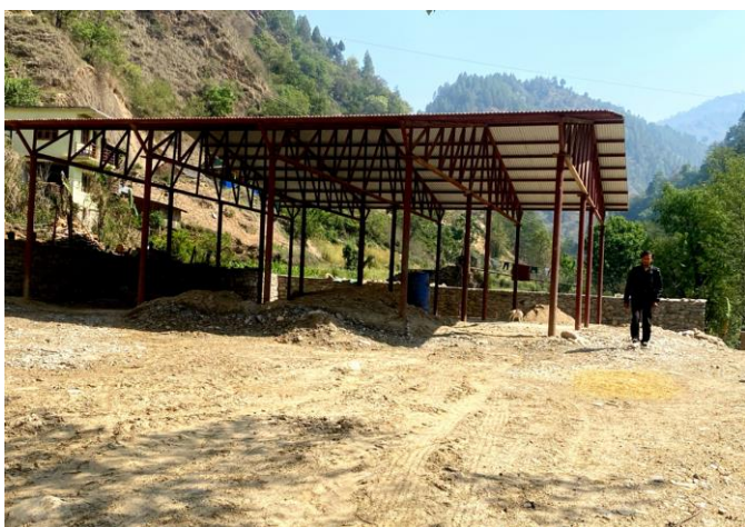
वडा नम्बर ६ मा कोल्ड रुम निर्माण