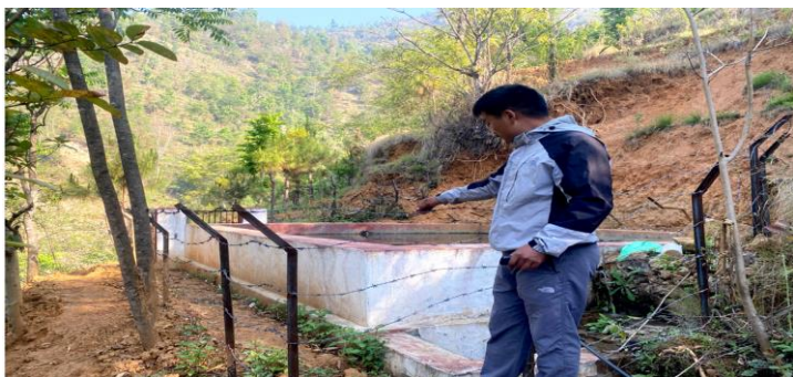
वडा नम्बर १ मा रहेको खाने पानी मर्मत