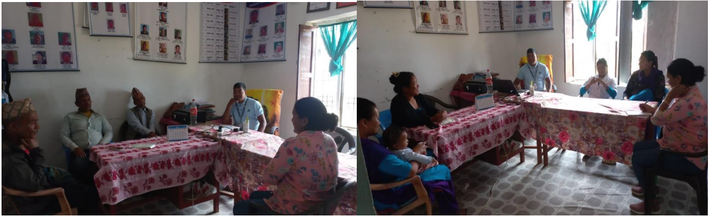
व्यवस्थापन समितीका पदाधिकारीहरु र स्वास्थ्य कर्मीहरुसंग अन्तरसंवाद गर्दै सामाजिक परिक्षकको टोली