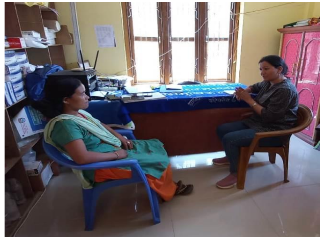
महिला स्वास्थ्य स्वयंसेविका र स्वास्थ्य आमा समूहसंग सेवाका सन्दर्भमा छलफल गर्दै सामाजिक परिक्षक