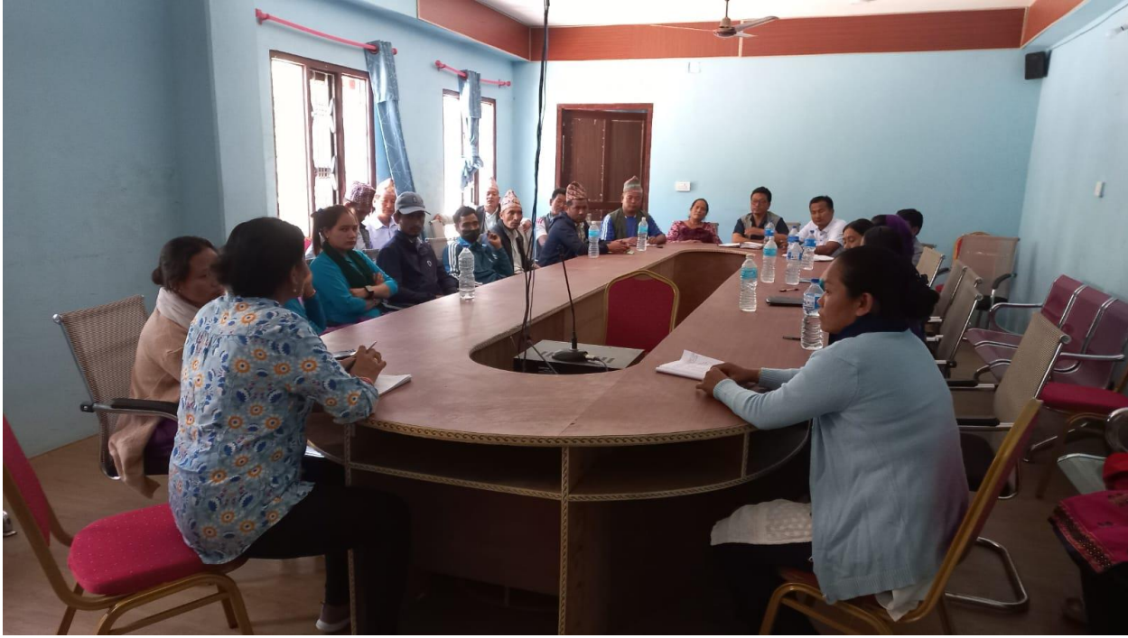
सामाजिक परिक्षणपूर्व तयारी बैठकका सन्दर्भमा छलफल गर्दै गर्दाको तस्वीर