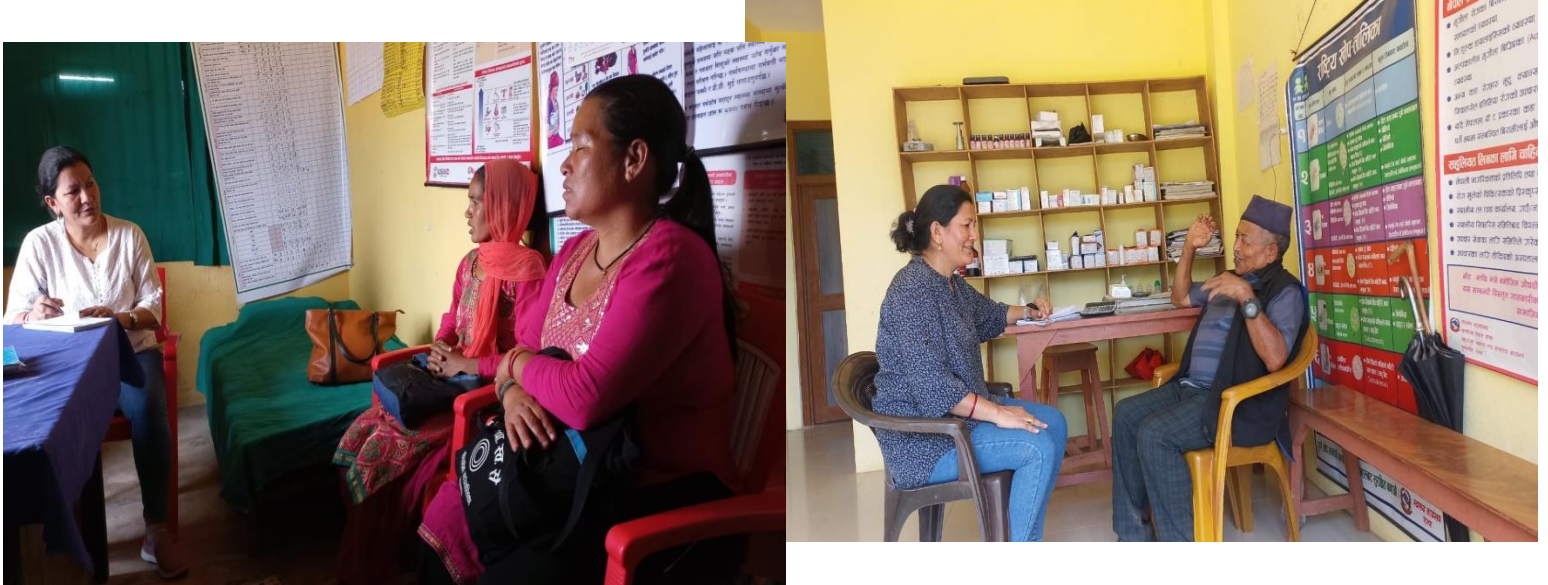
सेवा प्रवाहको अवस्थाका विषयमा सेवाग्राहीसँग कुराकानी गर्दै गर्दाको तस्वीर

स्वास्थ्यकर्मीहरु र सेवाग्राहीसँग सेवा प्रवाहको विषयमा छलफल तथा अन्नतरक्रिया गर्दै गर्दाको तस्वीर