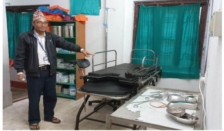
सुत्केरी कक्षमा जानकारी गराउदै हुनुहुन्छ ।